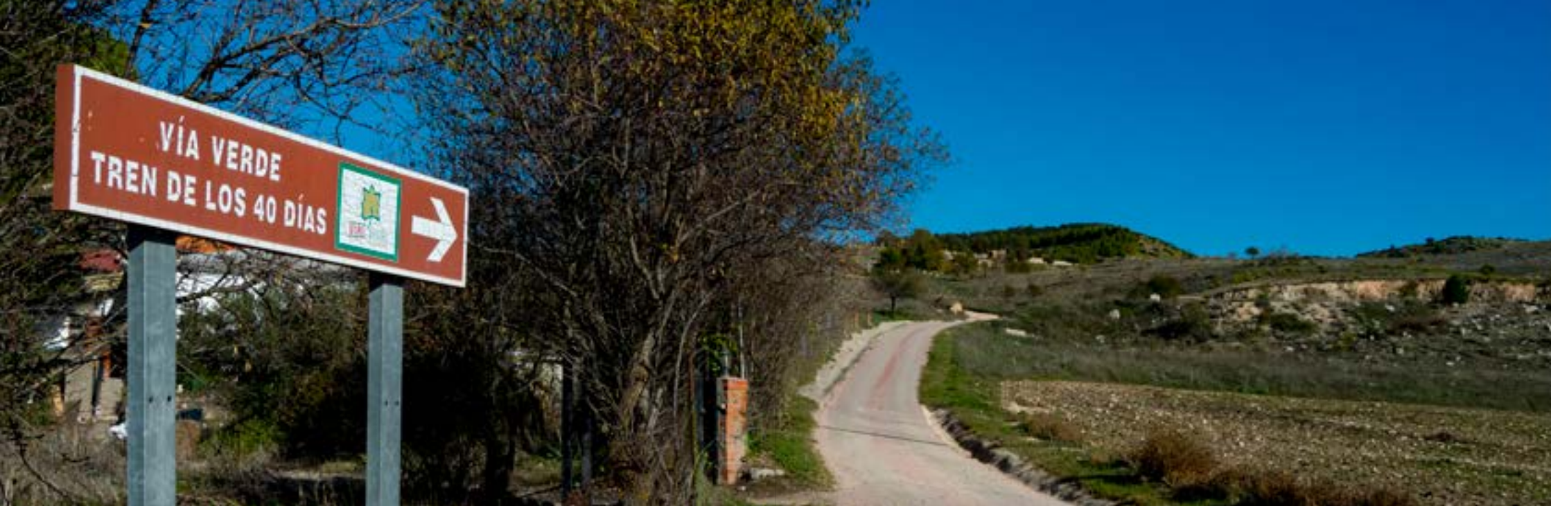
Vía Verde. Carabaña.