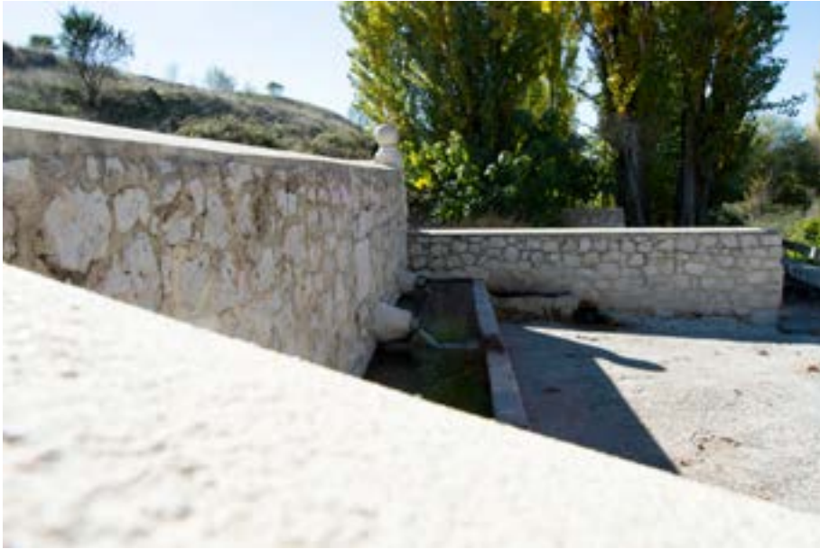
Fuente Grande. Corpa