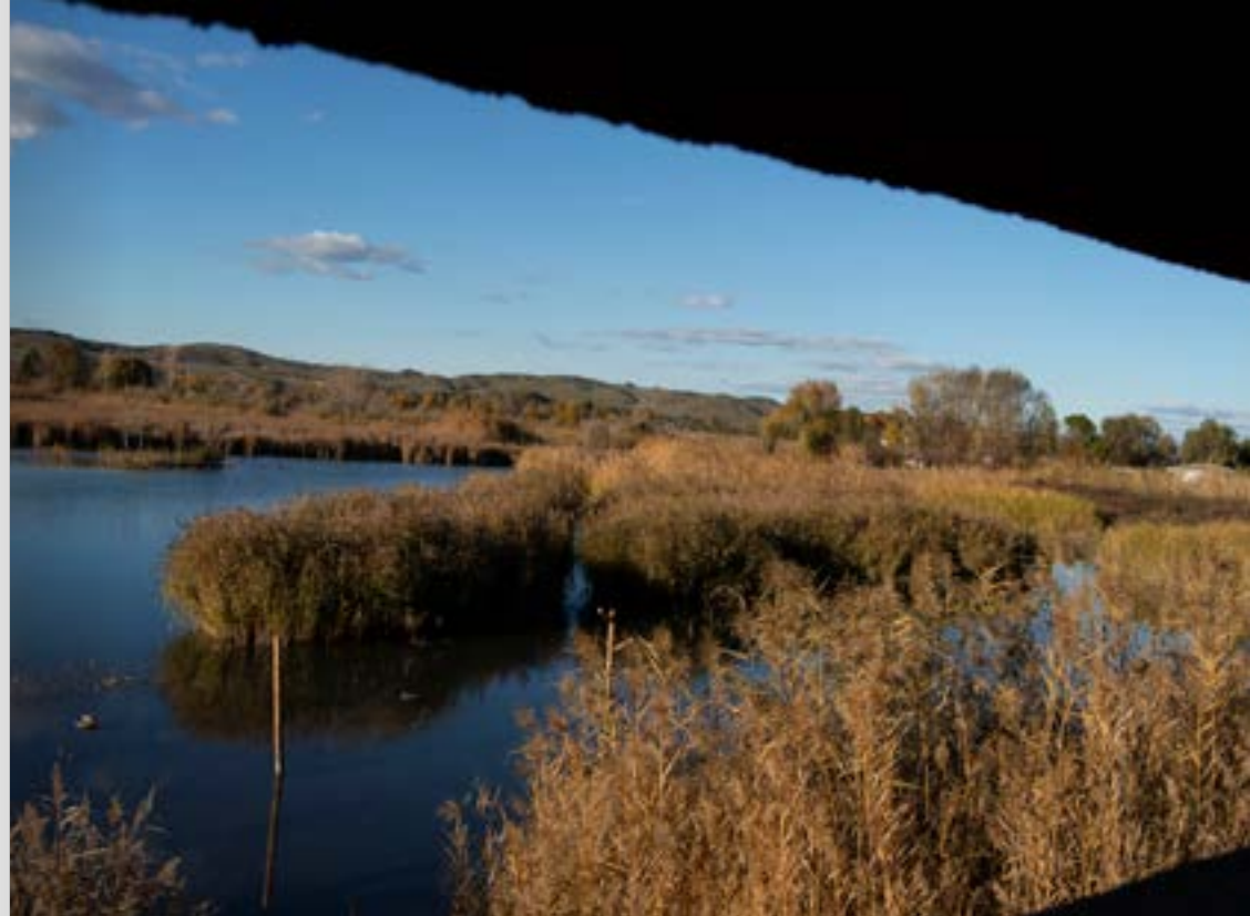
Hide-Mirador Laguna de San Juan. Chinchón.

Más información: http://www.ciudad-chinchon.com/turismo/conoce-chinchon/rutas/rutas-naturales/ruta-laguna.php