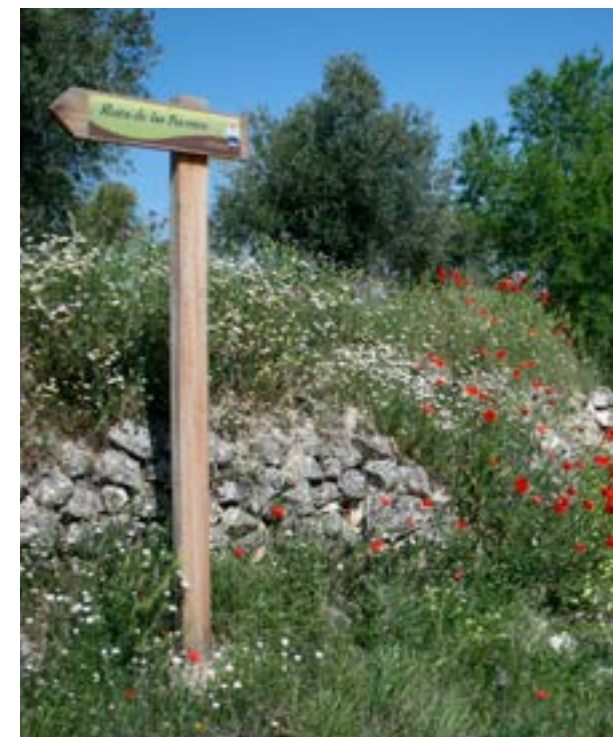
Ruta de las Fuentes. Valdelaguna.