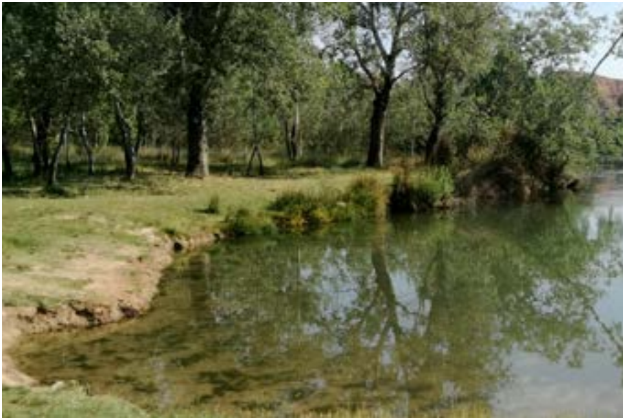
Playa de los Villares. Estremera.