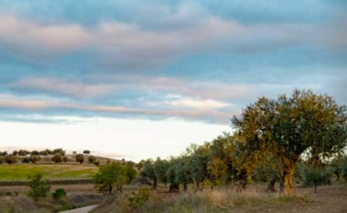
Ruta del Barranco de Villacabras. Villacabros.