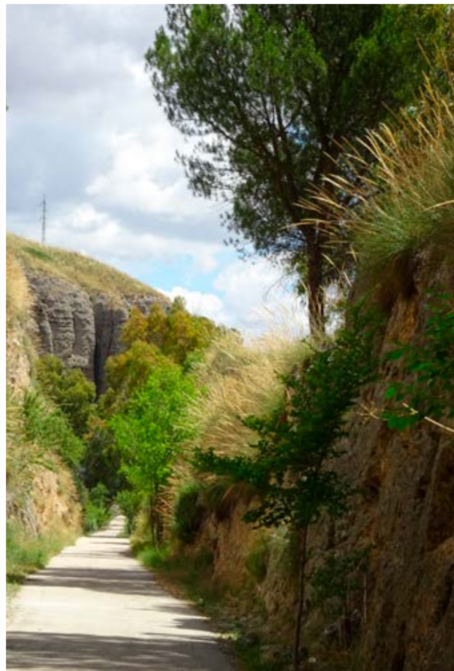
Perales de Tajuña.