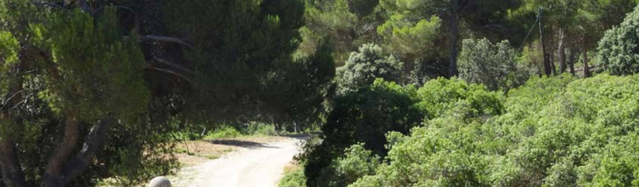
Pinar de la Encomienda. Villarejo de Salvanes.