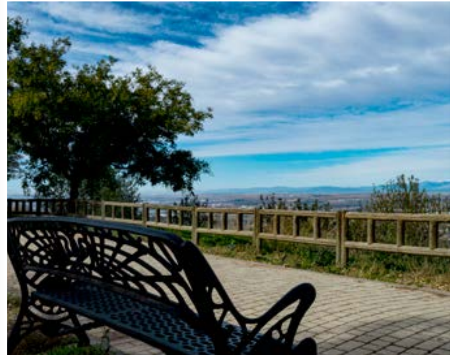
Mirador. Santos de la Humosa.

Más información: https://www.aracove.com/rutas-sures-te-madrid/ruta1-pozuelo-del-rey-a-valverde-de-alcala/