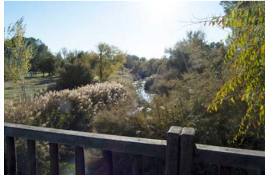
Senda Ecológica del Tajo. Villamanrique de Tajo.

Coordenadas Google maps: 40.15940163586792, -3.0926351752397503