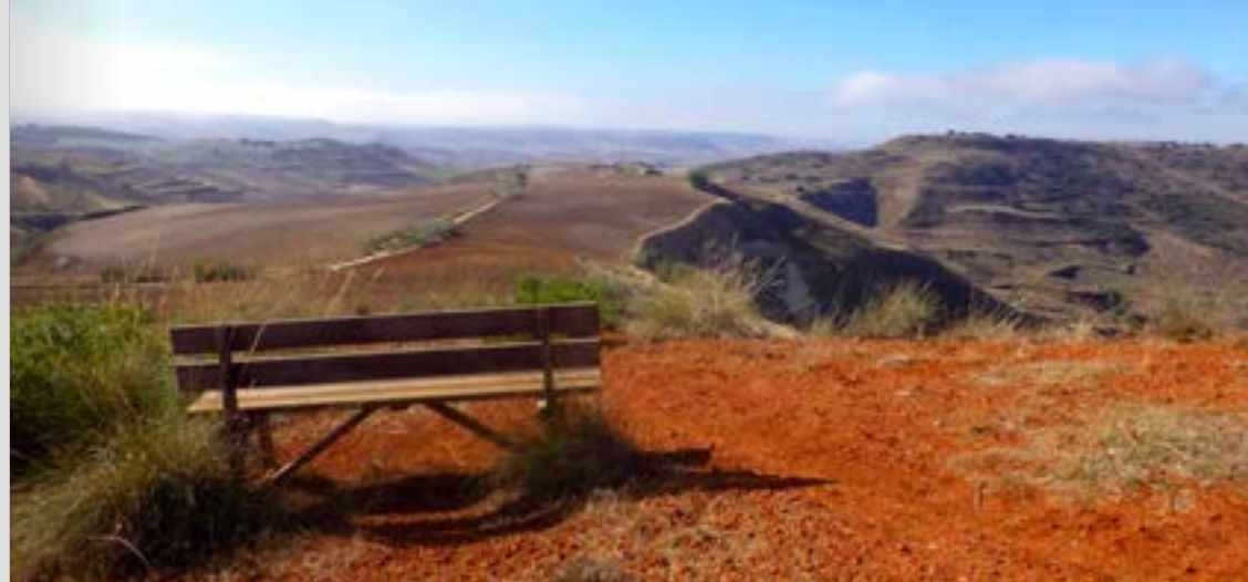
Mirador Peña Bermeja. Los Santos de la Humosa.

Esta es la ruta más corta, pero sin duda la más divertida de todas para subir a la Peña Rondán, desde donde se podrá disfrutar de unas vistas impresionantes y visitar las cuevas que la conforman. Podrás seguir hasta llegar a un punto con unas vistas privilegiadas del Palacio de Goyeneche (en la cercana Villa de Nuevo Baztán). A unos cientos de metros tendrás la oportunidad de visitar una calera en muy buen