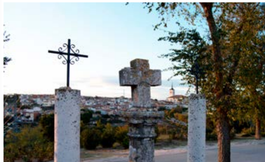
Vereda del Cristo. Morata de Tajuña.

Más información: https://valdelaguna.org/ruta-fuentes/